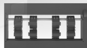
Accesorio rotatorio opcional