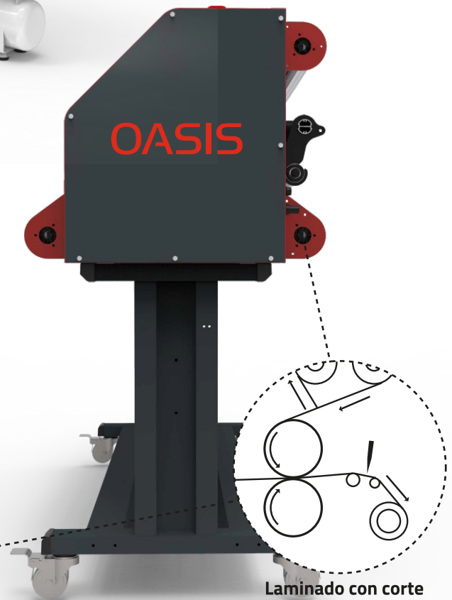
Laminado con corte

Tecnología avanzada con una calidad/precio excelente